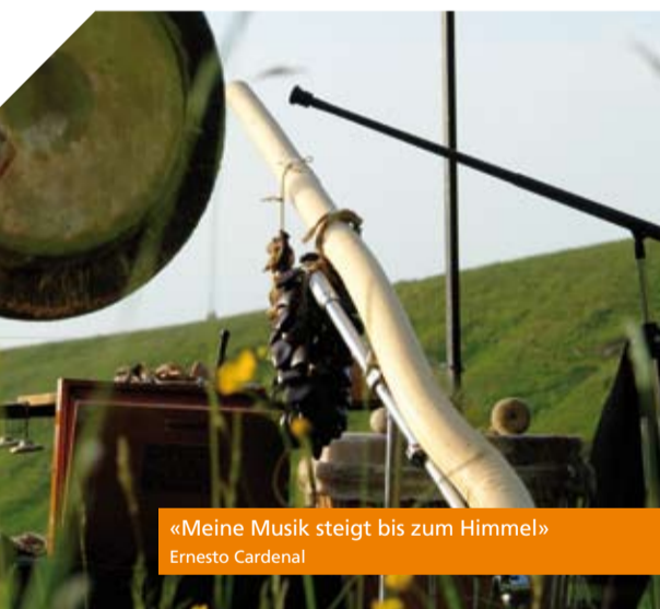
«Meine Musik steigt bis zum Himmel» Ernesto Cardenal

MITNEHMEN Wanderschuhe, Regenschutz, Sitzunterlage oder Decke, ein Holzschicht, etwas zum Essen und Trinken, finanzieller Beitrag zur Kollekte